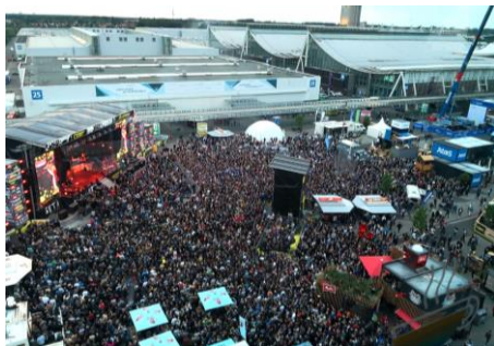
Konzert von Jan Delay (vom Riesenrad aus)

Auch der nächste Tag brachte einige Gespräche in internationalem Rahmen und ebenso konnten wir Vorträge verfolgen und spannende Attraktionen der CEBIT besuchen. Nach diesem erfolgreichen Messetag erkundeten wir auf eigene Faust noch die Innenstadt Hannovers.